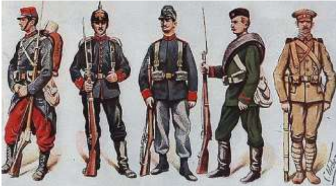
Формы солдат первой мировой

Также таблица показывает, что фактически война шла между Россией и Германией. Обе страны потеряли убитыми 4,3 миллиона человек, а Великобритания, Франция и Австро-Венгрия вместе потеряли 3,5 миллиона человек. Цифры красноречивы. Но получилось так, что страны, которые больше всего воевали и приложили усилий в войне, оказались ни с чем. Сначала Россия подписала позорный для себя Брестский мир, потеряв множество земель. Потом и Германия подписала Версальский мир, по сути, утратив самостоятельность.