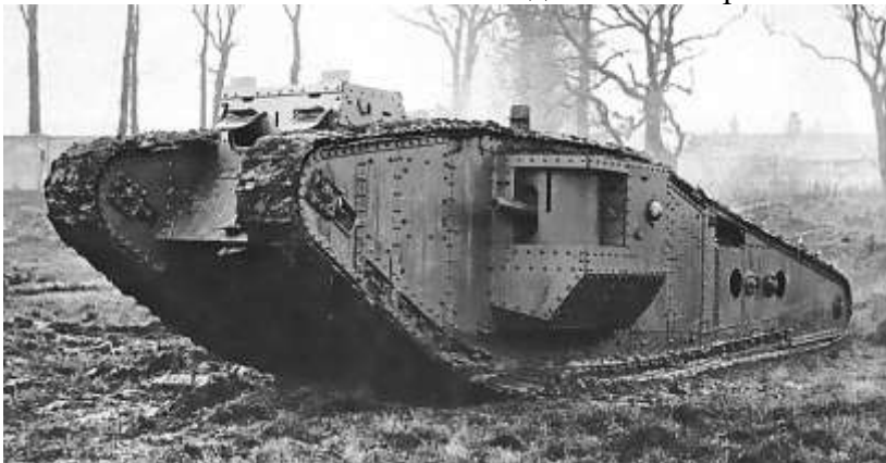
Танки первой мировой войны

Данная таблица четко показывает слабость Российской Империи в плане оснащения армии. По всем основным показателям Россия сильно уступает Германии, но также уступает и Франции с Великобританией. Во многом из-за этого война оказалась для нашей страны такой сложной.