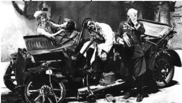
Убийство Франца Фердинанда в Сараево

Поводом к началу Первой мировой войны послужили события в Сараево (Босния и Герцеговина). 28 июня 1914 года член организации «Черная рука» движения «Молодая Босния» Гаврило Принцип убил эрцгерцога Франца Фердинанда. Фердинанд был наследником австро-венгерского престола, поэтому резонанс у убийства был громадный. Это был повод Австро-Венгрии напасть на Сербию.