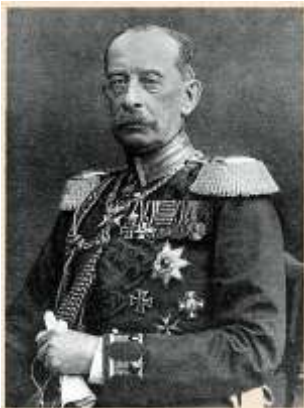
Альфред фон Шлиффен

Германия оказалась под угрозой войны на два фронта: Восточный – с Россией, Западный – с Францией. Тогда немецкое командование разработало «план Шлиффена», согласно которому Германия должна за 40 дней разгромить Францию и потом уже воевать с Россией. Почему 40 дней? Немцы считали, что именно