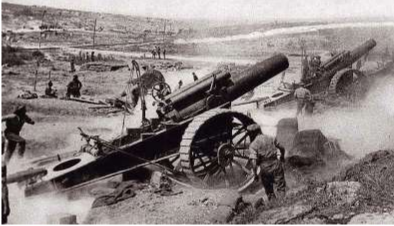
Тяжелая артиллерия времен первой мировой войны

(1870-71) Германия выпустила чуть более 800 000 снарядов. То есть за 4 часа немного меньше, чем за всю войну. Немцы четко понимали, что решающую роль в войне сыграет тяжелая артиллерия.